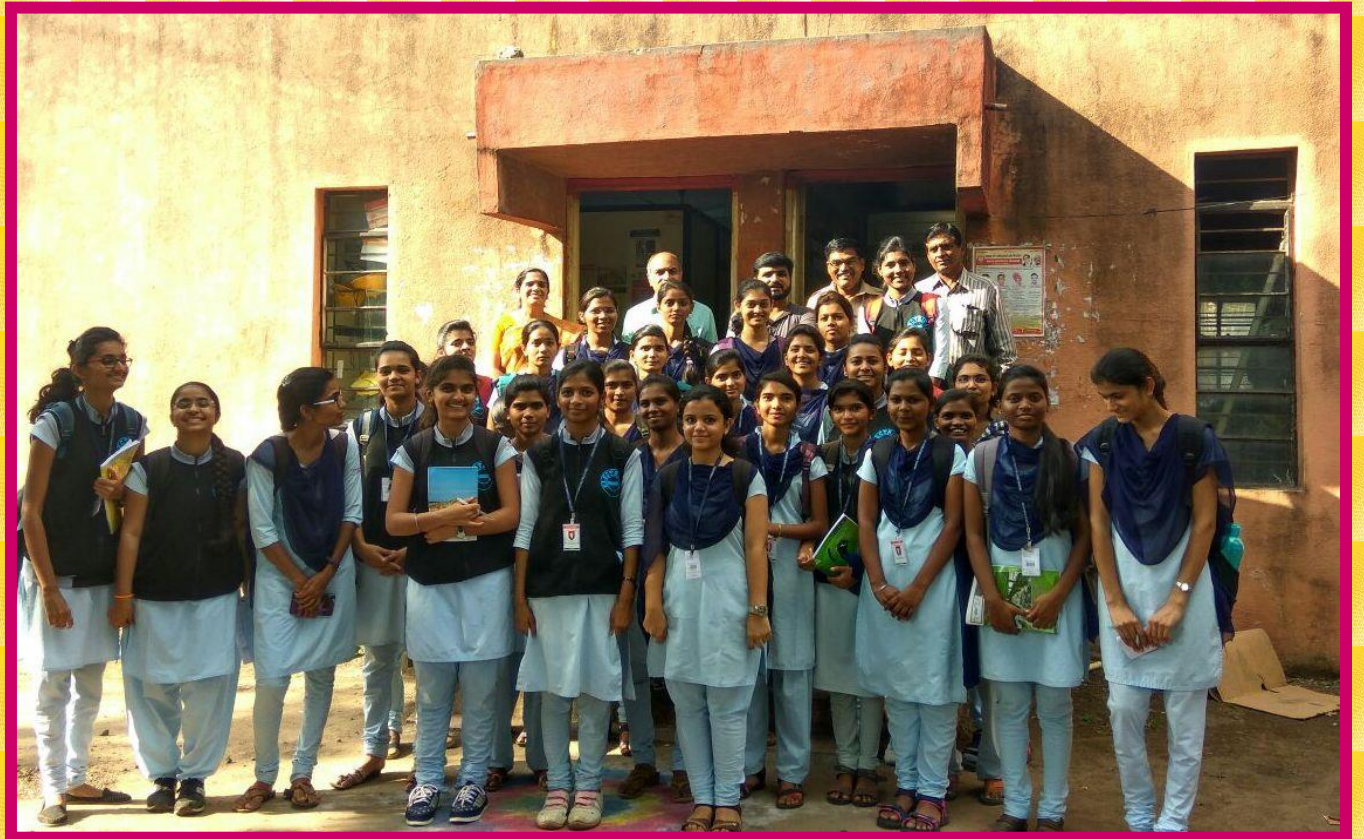
❖ Industrial visit to “33kV/11kV Somani garden Sub- station, Nashik” of third year students on 06/09/2017.