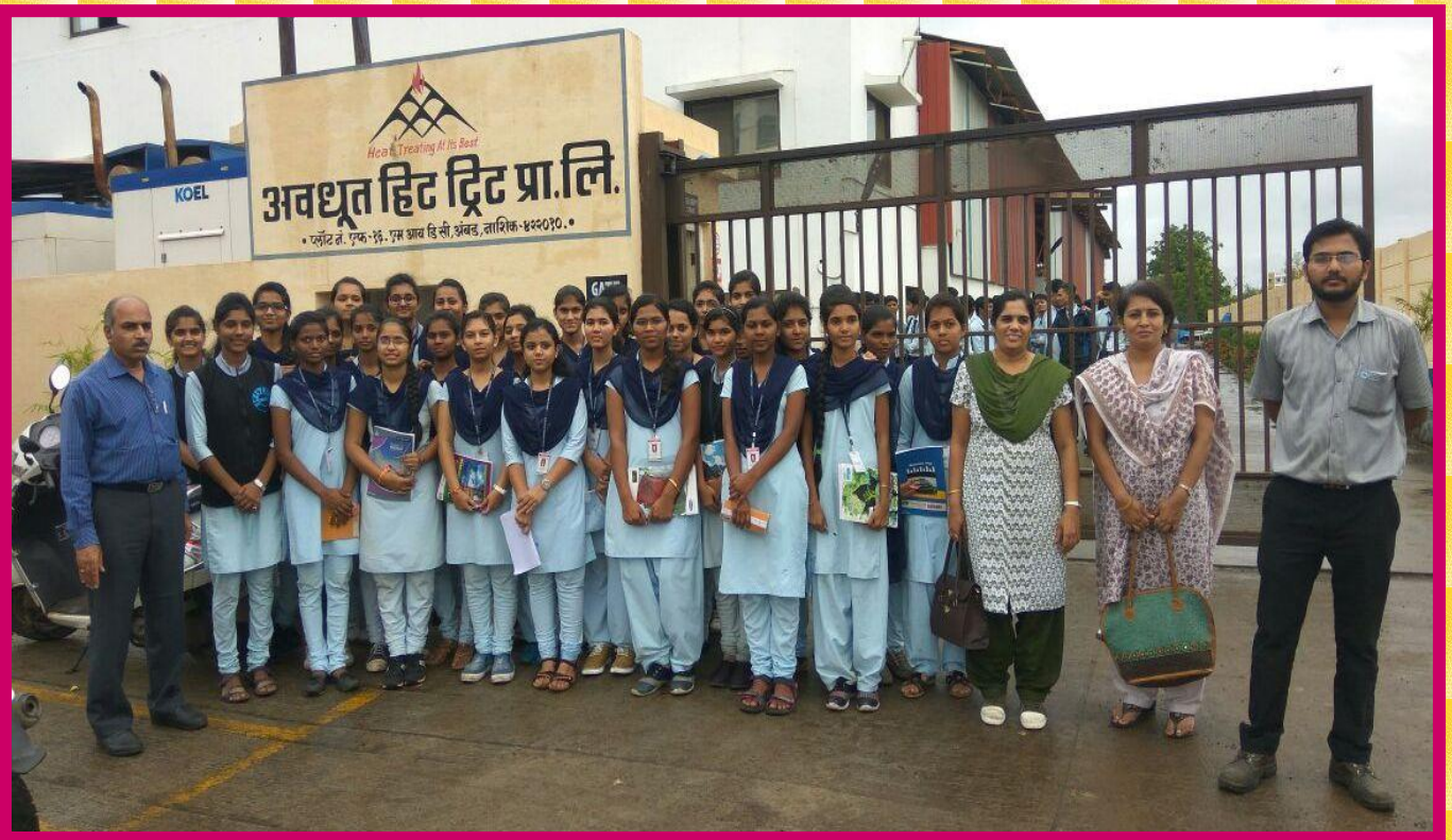
❖ Industrial visit to “Avdoot Heat treat Pvt. Ltd.,Nashik ” of third year students on 28/08/2017.